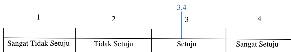
Gambar 3. Hasil Kuesioner Penerapan Aplikasi Kehadiran

Penelitian ini berhasil memberikan kontribusi pada penelitian sebelumnya, yaitu aplikasi penyajian informasi kehadiran dengan teknologi augmented reality berbasis android untuk menampilkan data dalam bentuk augmented reality dan mempermudah pengajar/guru untuk melihat data kehadiran siswanya [22]. Penelitian ini mempermudah pengaksesan informasi kehadiran dengan cara pendeteksian wajah penggunaanya. Hasil uji lapangan pada penilaian learnability dapat dikatakan bawah aplikasi persentase kehadiran ini telah mempermudah pengaksesan data persentase kehadiran.