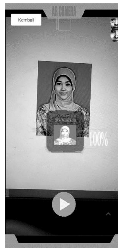
Gambar 2c. Halaman Kamera