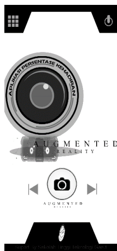
Gambar 2b. Halaman Menu