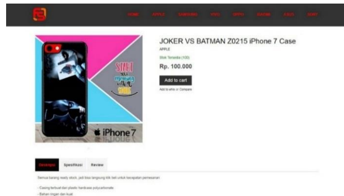
Gambar 2. Contoh produk yang dipilih oleh user .

Sistem akan mencari produk yang mempunyai kategori sama dengan produk yang dilihat oleh user dan produk yang dilihat user tidak dimasukkan ke dalam proses rekomendasi, maka akan menjadi seperti Gambar 3 di bawah ini.