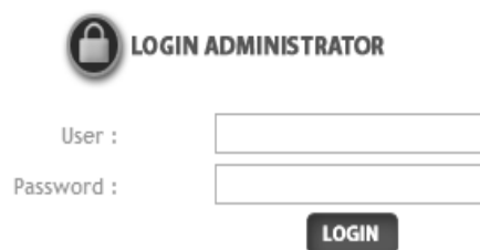
Gambar 14. Rancangan Input Login Admin