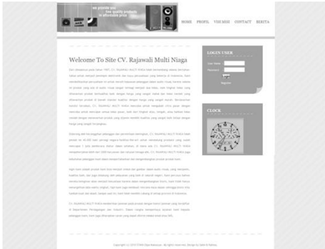
Gambar 2. Rancangan Output Home