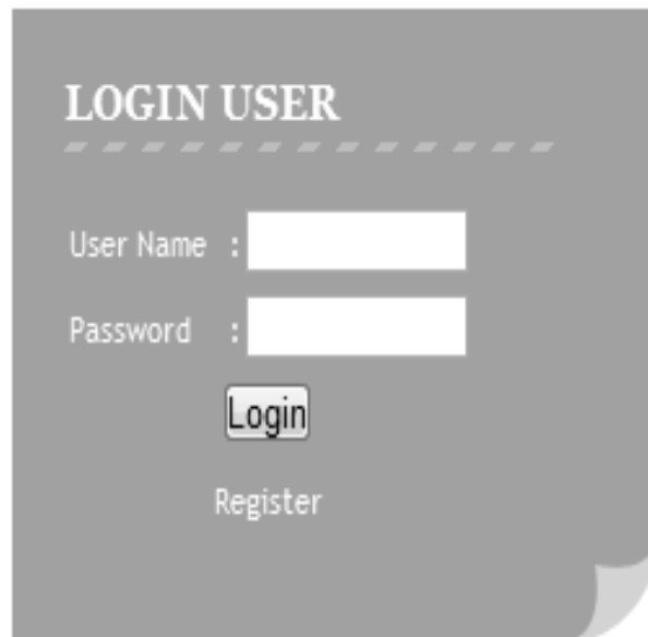
Gambar 13. Rancangan Input Login User