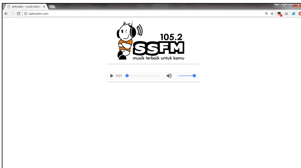
Gambar 2. Tampilan lama website Radio SSFM Semarang.