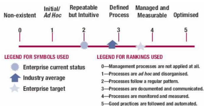
Gambar 1. Capability maturity model .

COBIT dapat membantu auditor , manajemen, dan pengguna untuk menjembatani pemisah ( gap ) antara risiko bisnis, kebutuhan pengendalian, dan permasalahan-permasalahan teknis. Maturity model untuk pengendalian dalam proses IT berisi tentang pengembangan Metode penilaian, sehingga organisasi dapat memberi penilaian sendiri dari non-existent sampai optimized (dari 0-5).